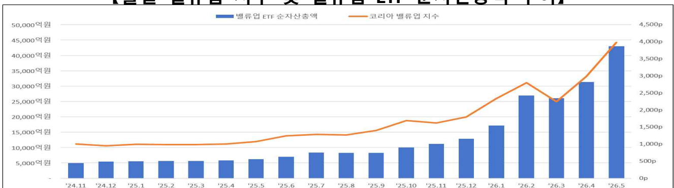
【월별 밸류업 지수 및 밸류업 ETF 순자산총액 추이】