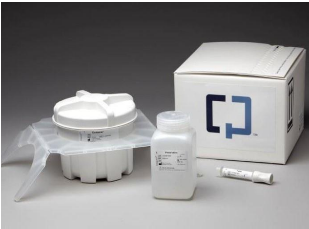
자료: Exact Sciences, 키움증권 리서치