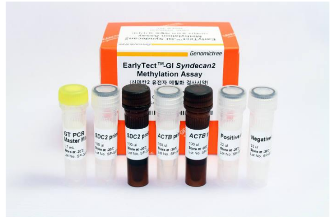
자료: 지노믹트리, 키움증권 리서치